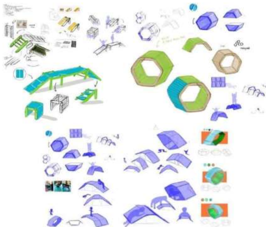
Gambar 4. Alternatif Desain