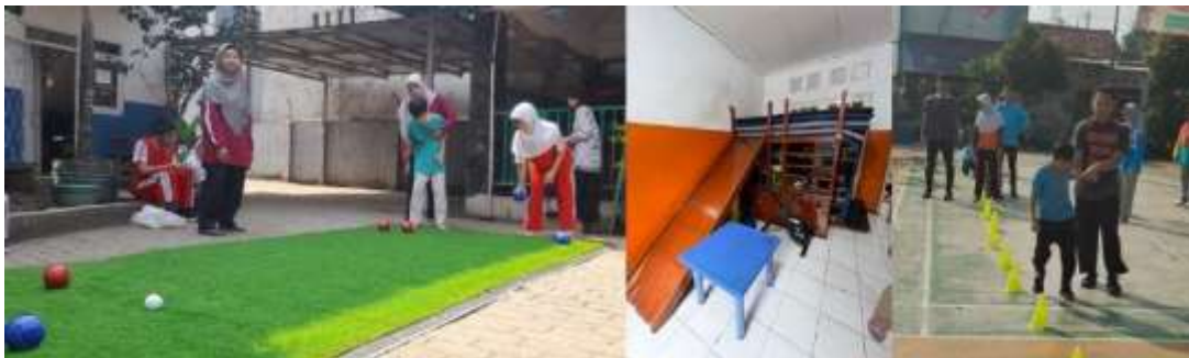
Gambar 2. Sarana belajar sensori dan wahana bermain dari 3 Skh di Tangerang Selatan