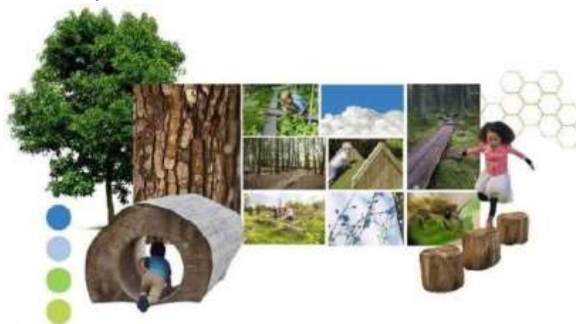
Gambar 3. Moodboard

Perancangan produk ini ditujukan untuk sekolah luar biasa swasta kecil yang menyediakan program Terapi Sensori Integrasi namun tidak memiliki fasilitas terapi SI yang memadai karena adanya keterbatasan ruang yang terkadang menggunakan ruang kelas dialihfungsikan menjadi ruang terapi. Produk ini dikhususkan bagi anak down syndrome dengan keterlambatan gerak lokomotor. Selain itu, produk ini dirancang untuk penggunaan individual di ruang tertutup (indoor) agar lebih aman, nyaman, terawasi dan fokus. Pemanfaatan ruang yang ada di sekolah menjadi fokus utama pemecahan keputusan desain. Diharapkan bahwa fitur yang dirancang harus memberikan informasi yang sesuai dengan tujuan gerakan lokomotor, sehingga perlu ada Batasan - batasan mengenai penggunaan fitur yang akan di desain sehingga anak dapat menyesuaikan dalam pemakaiannya. Tiap bentuk yang dihasilkan diharapkan mampu mempengaruhi sisi kognisi anak agar anak dapat merespon bahwa bentuk tersebut merupakan dasar loncatan adaptasi lingkungan luar sehingga perlu ada pengalaman perasaan yang mampu menimbulkan rasa nyaman..