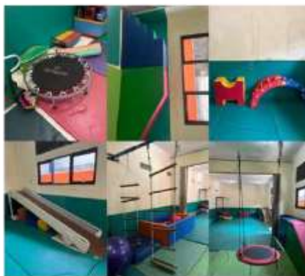
Gambar 1. Tingkat Kelulusan Sertifikasi

Selain itu, fasilitas yang umum digunakan untuk terapi sensori integrasi sangat bebas, karena seluruh alat digunakan untuk berbagai penyandang diantaranya gangguan autisme, hambatan intelektual, pasca trauma atau cedera, gangguan koordinasi perkembangan dan kesulitan mengendalikan sosial - emosional. Menurut Terapis Eka N Andari Putri, fasilitas SI itu disesuaikan dengan kebutuhan dasar seperti ayunan yang dapat memaksimalkan sistem vestibular anak dan papan titian untuk proprioseptif, kesadaran dan kontrol postur.